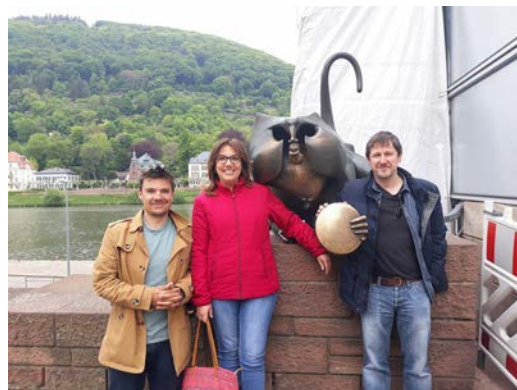
Die Kollegen verstanden sich auf Anhieb

Angefangen hat es über das Internet. Später wurde es spontan und kompliziert. Und am Ende ein voller Erfolg. Was sich zunächst anhört wie eine verworrene Beziehungsgeschichte, beschreibt eigentlich ganz gut die Entstehung dieses Kulturaustausches, den die Klasse 9b dieses Schuljahr im Rahmen des europäischen Kulturjahres 2018 mit dem Colegio Ntra. Señora del Rosario in Albacete organisiert hat. Der Besuch der spanischen Delegation in Bruchsal fand in der Woche vom 01.-06. Mai statt.